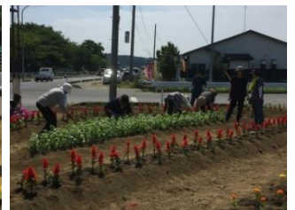
最も広い三角スペース