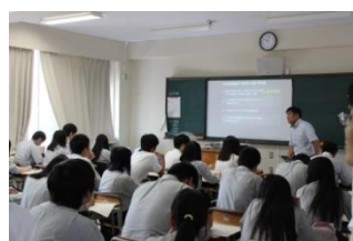
はじめに作業の説明

生徒達は各グループに配られた。iPadを自在に操作し発表資料を作成していました。