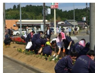
地域の方々とともに