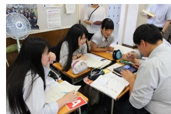
プレゼン資料の作成