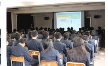
就職希望者への説明会