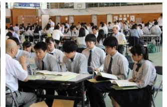
大学・短大・専門学校のブースで説明を聞く