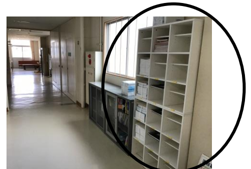
↑「配布物用クラスボックス」↑

委員会・部活・資格試験などの連絡が書かれます。基本は週番に、朝と帰りに確認し連絡してもらいますが、みなさんも確認し、連絡を見落とすことのないようにしてください。